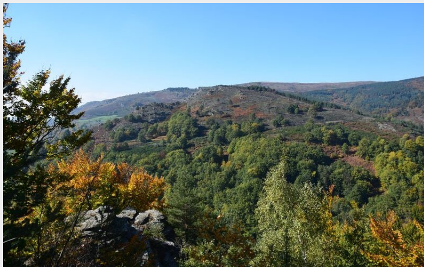
Vue sur Bougeset