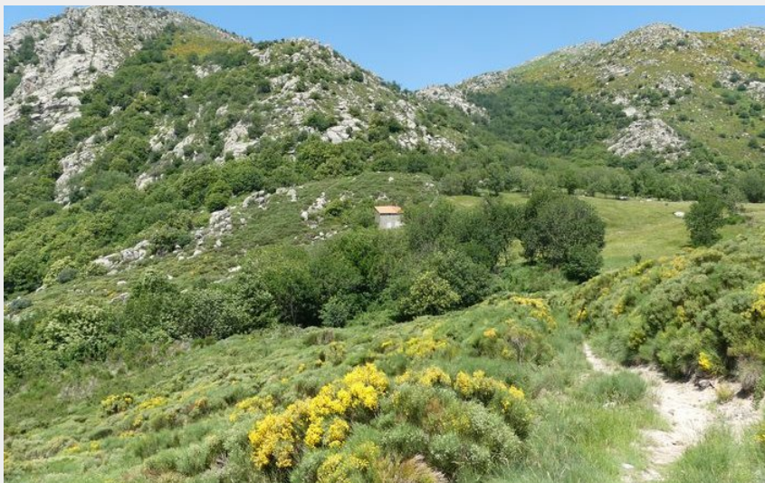
Col de Montclar