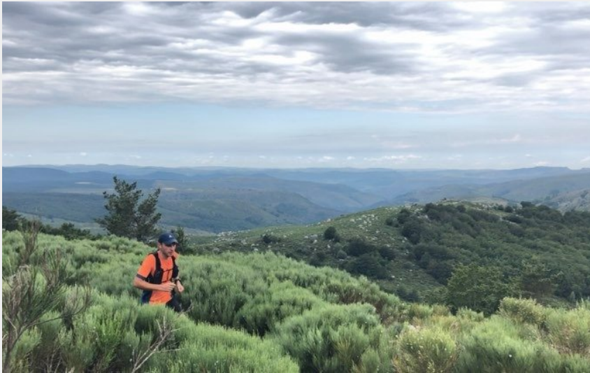
Coureur sur le Mont Lozère