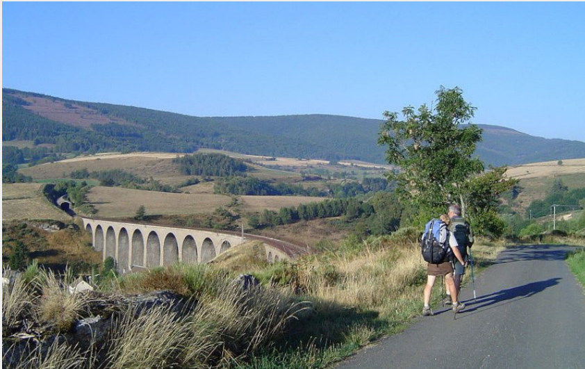
Viaduc de Mirandol, Chasseradès