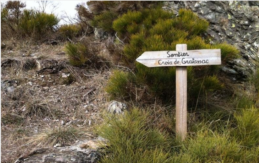
Chemin de la croix de Gratassac (Office de tourisme Mont Lozère)