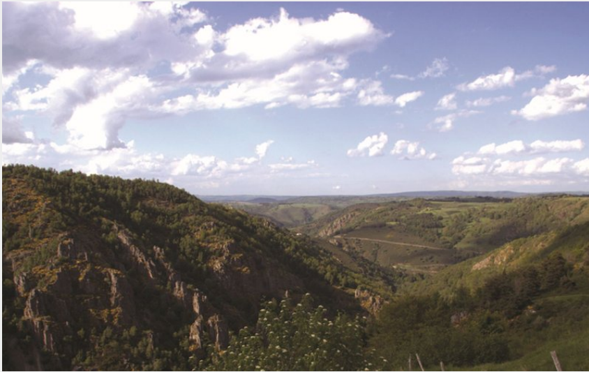
Les gorges du Bès