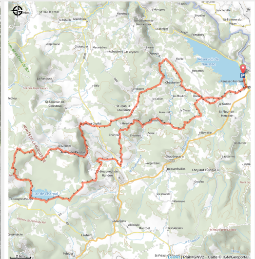
Sur les petites routes de la Margeride