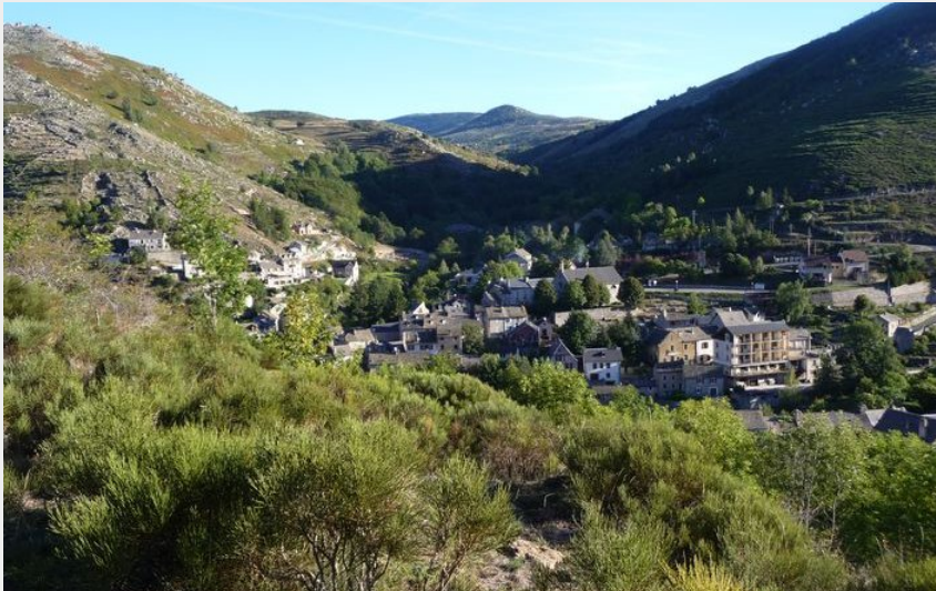
Vue sur le Pont de Montvert