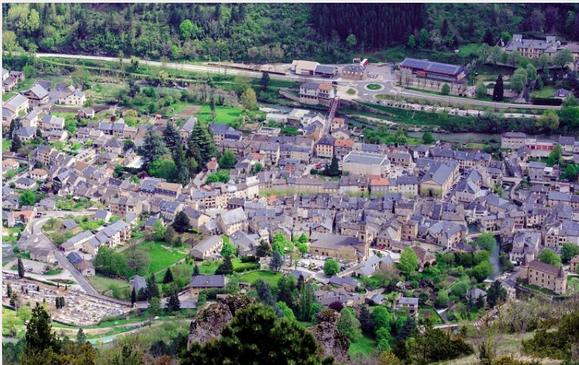
Florac vue du causse Méjean