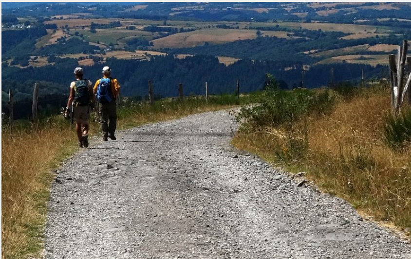
Randonneurs marchant vers le hameau des Enfrux (PNR Aubrac)