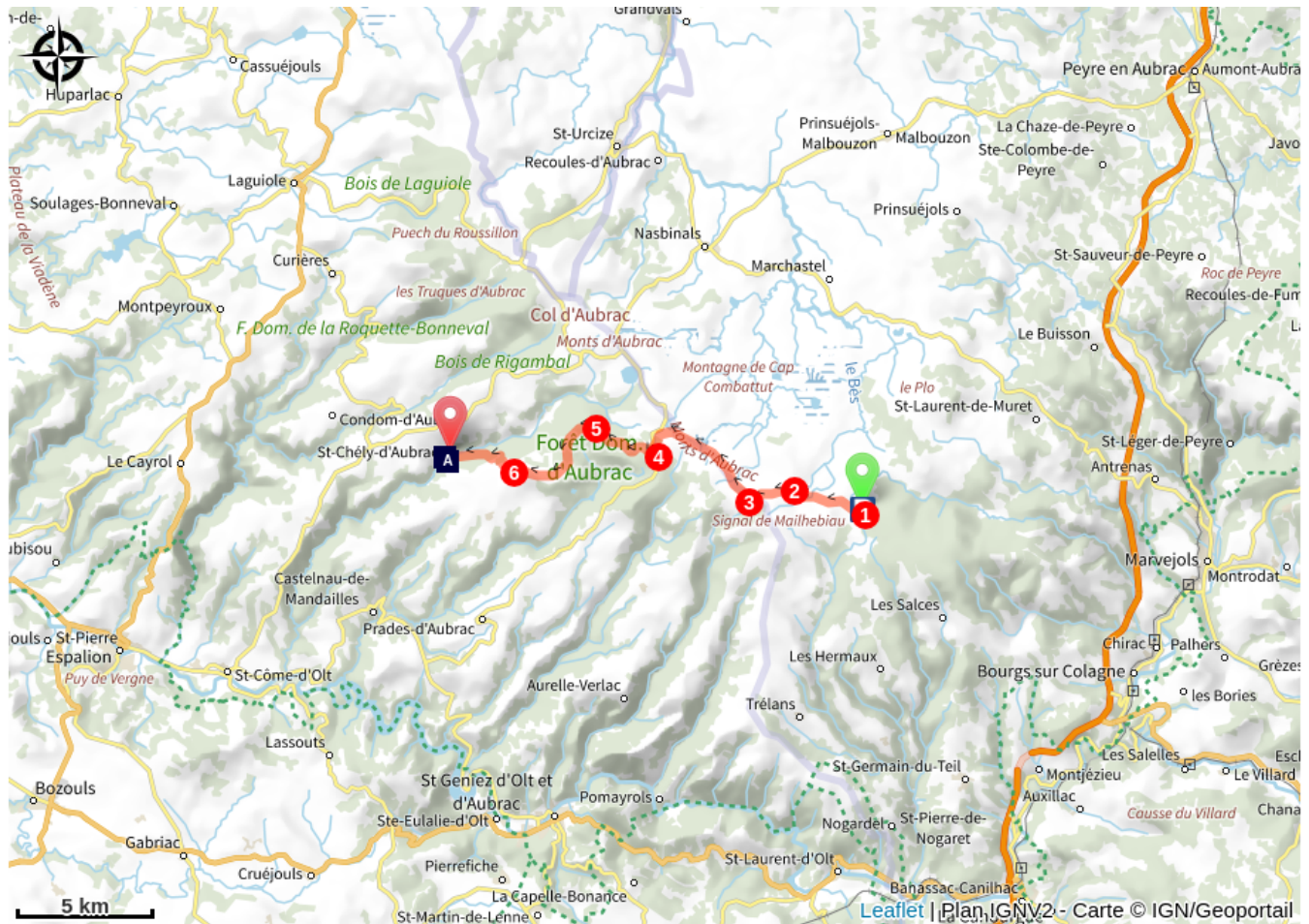
Pont des Pèlerins (A)