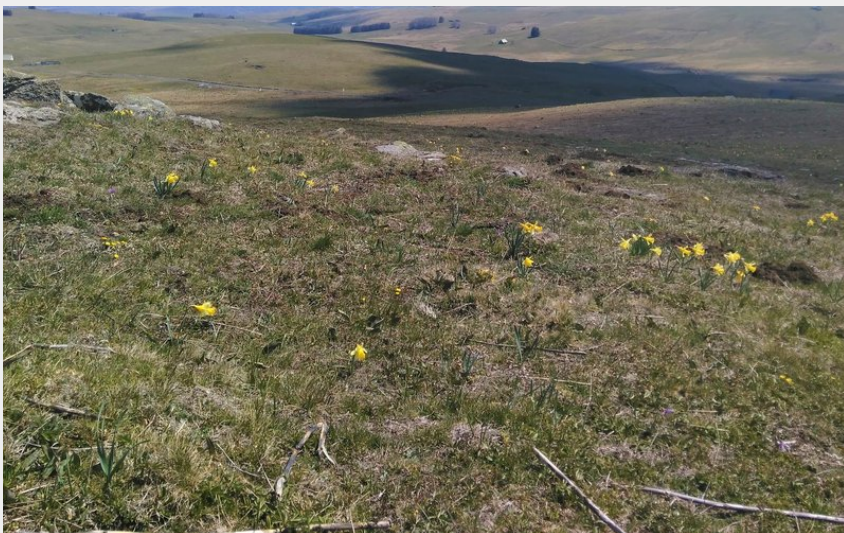
Les perspectives du haut-plateau