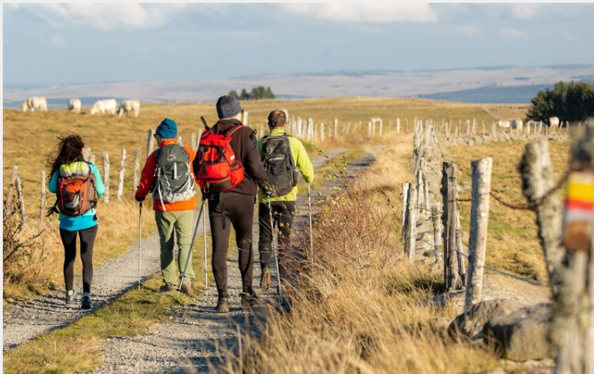
Randonneurs sur le Tour des Monts d'Aubrac