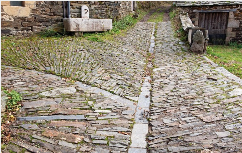
Calade à Auriac (Guy.Grégoire)