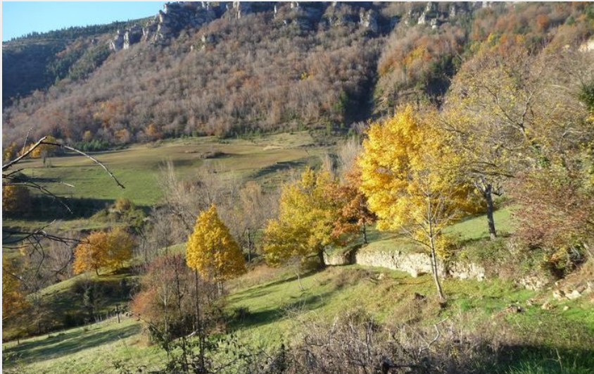
Vue sur les corniches