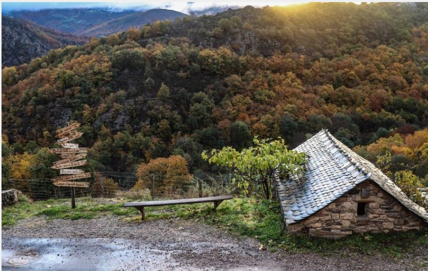
maison cévenole en pierres (de beaux lents demain)