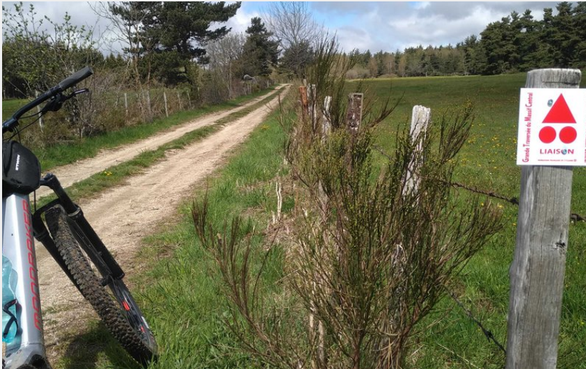
Exemple de balisage de la liaison