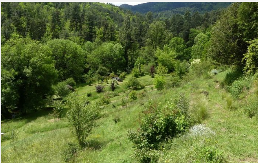
Jardin du Temple