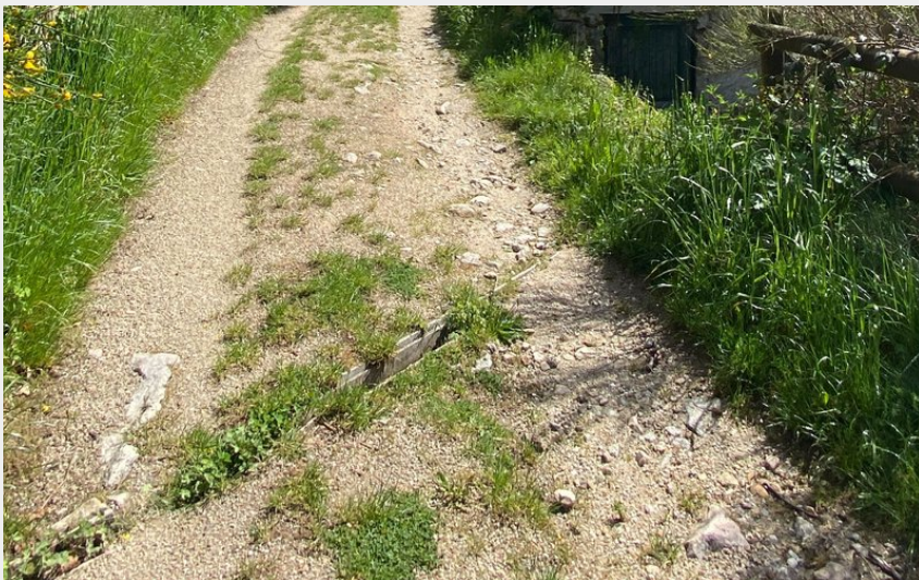
La cascade du Franquet