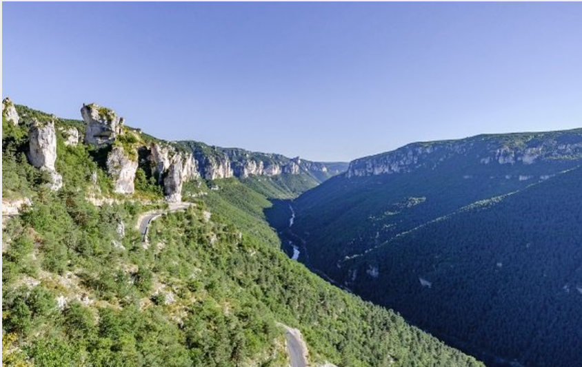
Paysages des Gorges