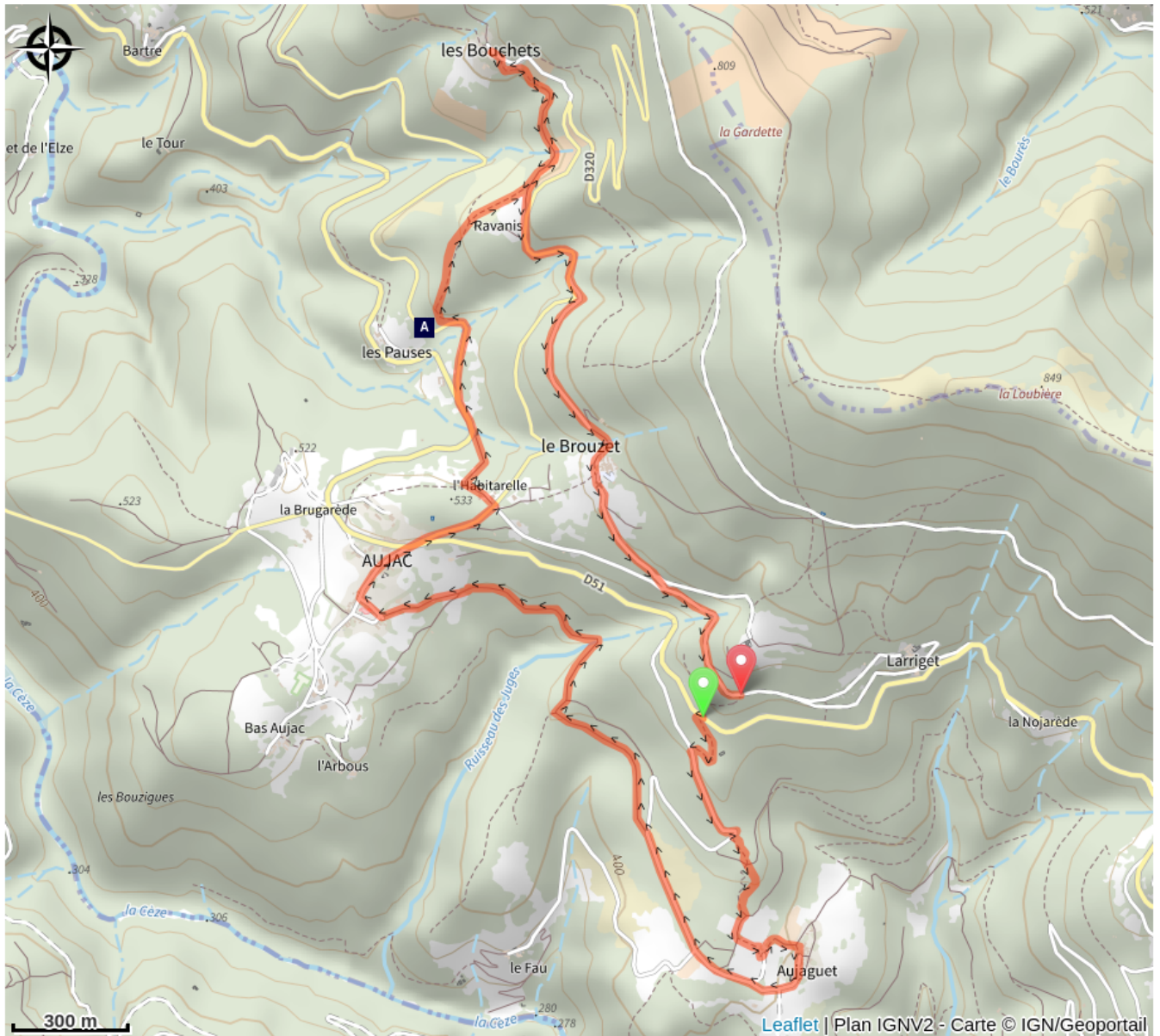
Le hameau des Pauses (A)