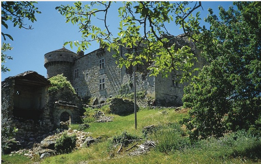
Château du Cheylard