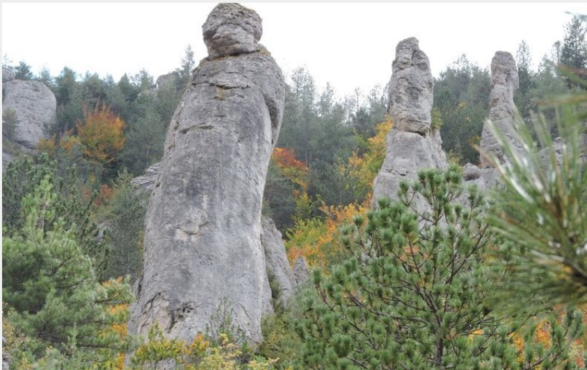
Les monolithes des Moines.