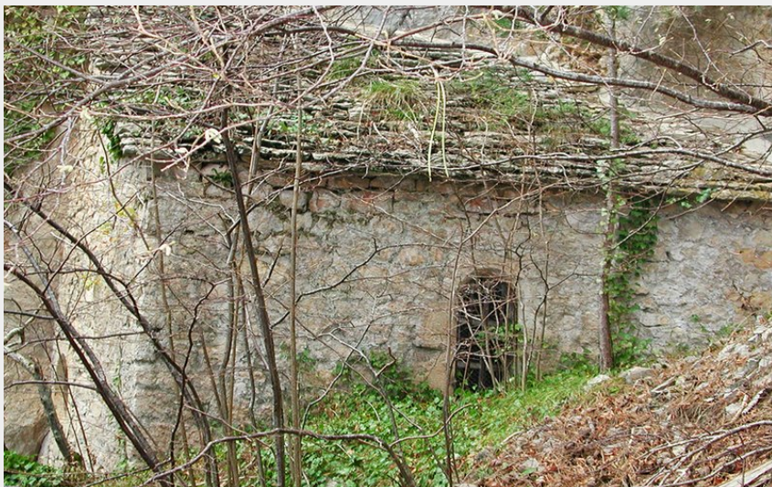
Chapelle de San Chaousou sur le Causse de Changefège