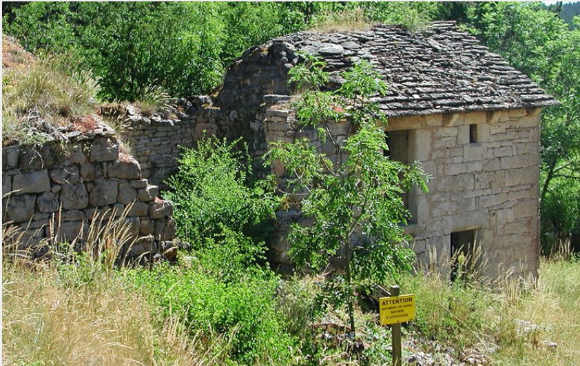
Hameau abandonné de la Chaumette