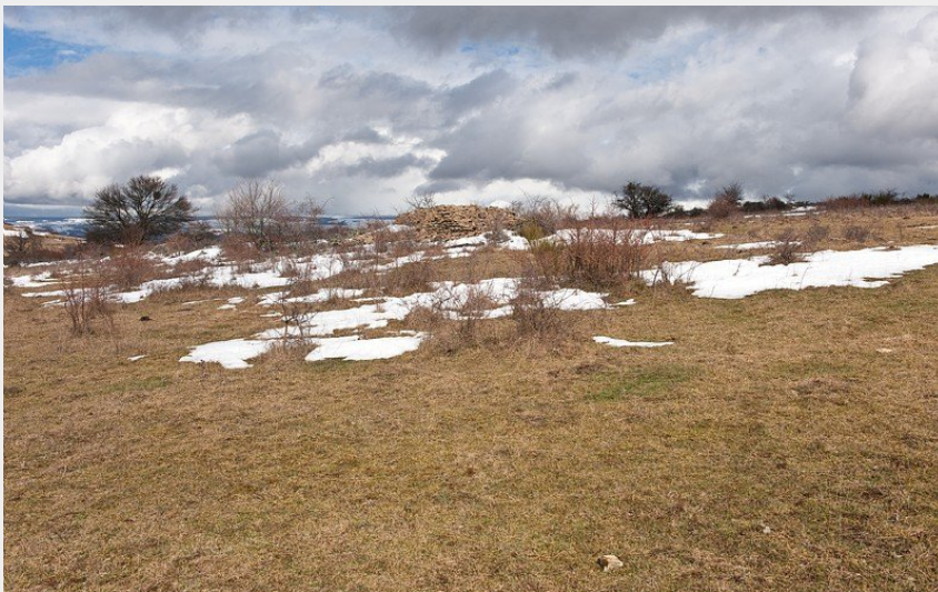
La Can de Ferrières (© Guy Grégoire)