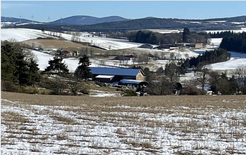
Vue sur les monts ardéchois