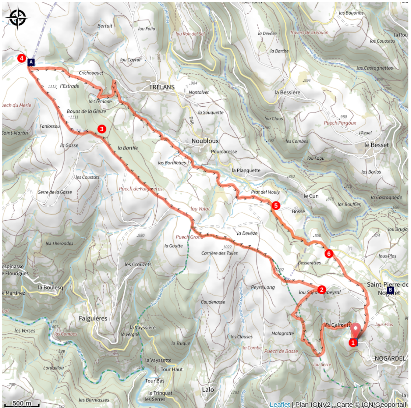
La Croix du Pal (A)