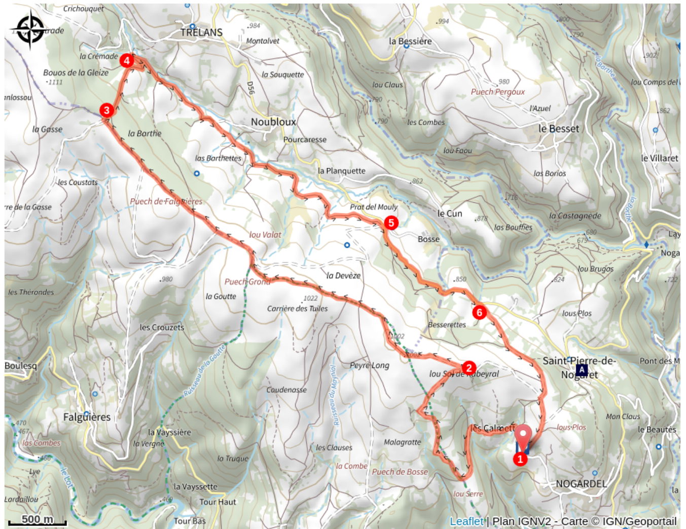
Eglise Romane de St Pierre de Nogaret (A)