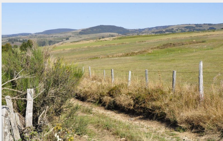
Les monts d'Aubrac depuis le chemin de crête