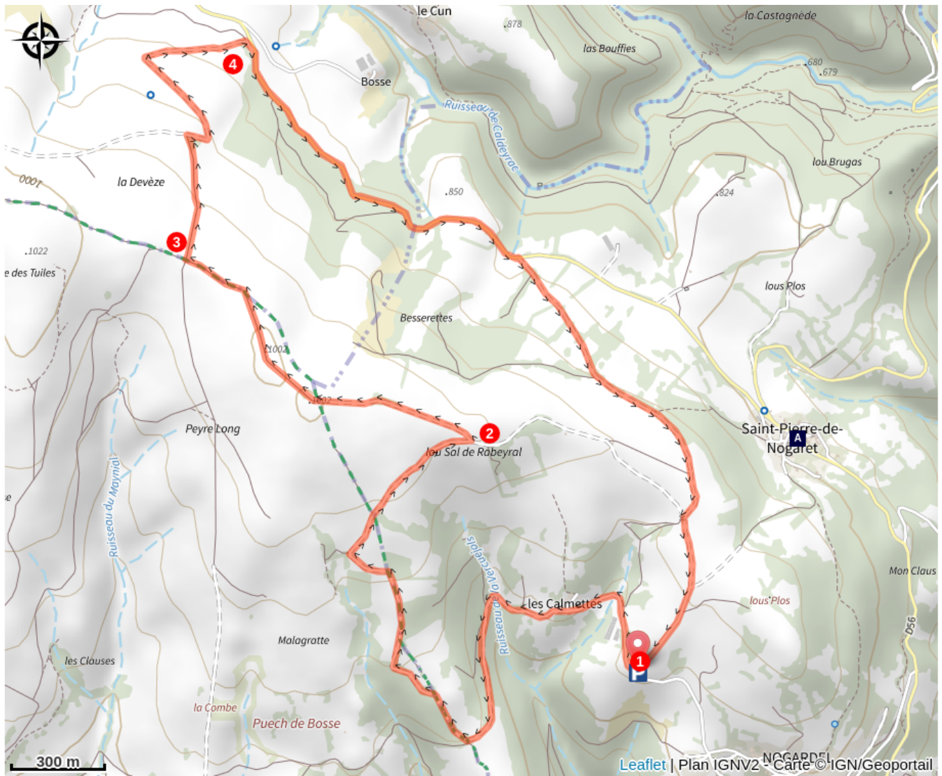
Eglise Romane de St Pierre de Nogaret (A)