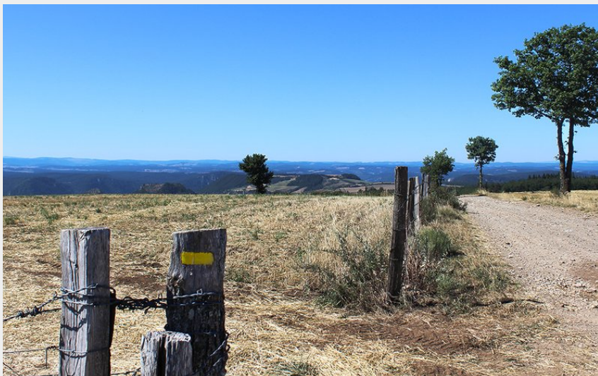
Vue sur le Sud-Ouest depuis la draille de la Boulaine (FS - OTI Mende)