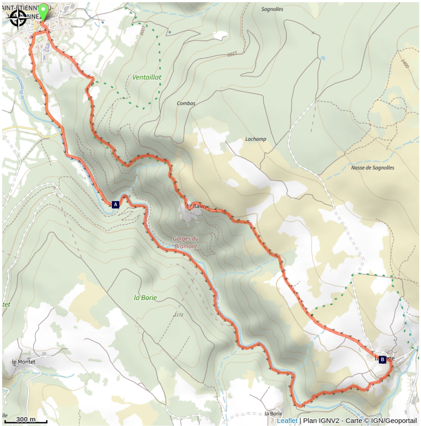
Le Bramont (A)