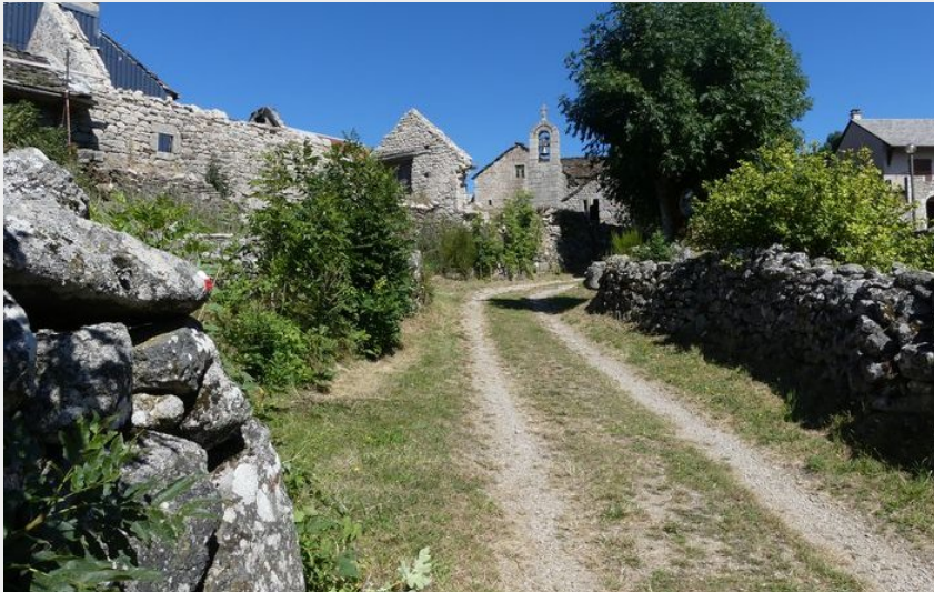
La Fage