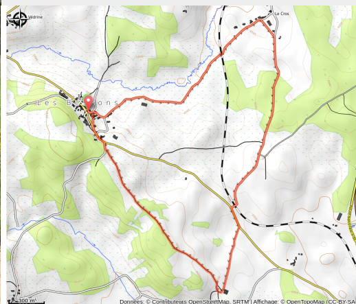
Randonnée - La forêt de la Tourre

Une randonnée accessible aux familles, au coeur des plaines et prairies fleuries. Très peu ombragée, idéale le matin ou en fin de journée.