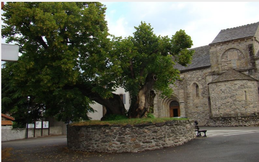
Tilleul de Sully