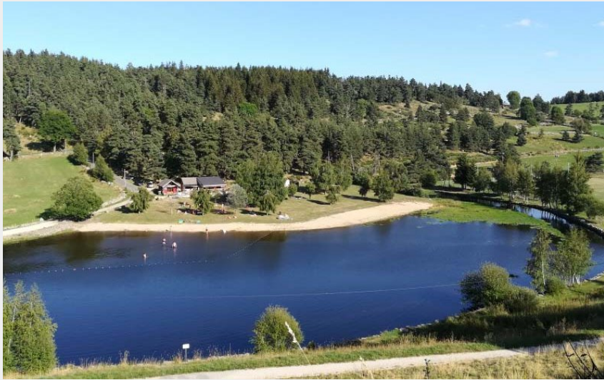
Le plan d'eau sur le ruisseau le Grandrieu