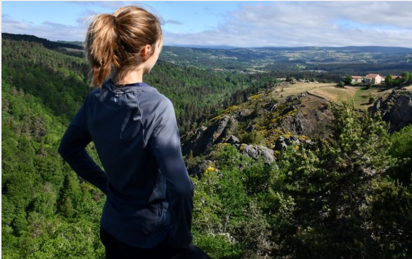
Pause contemplation