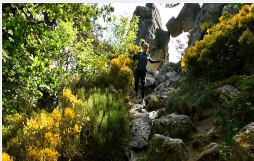
descente porte des fées