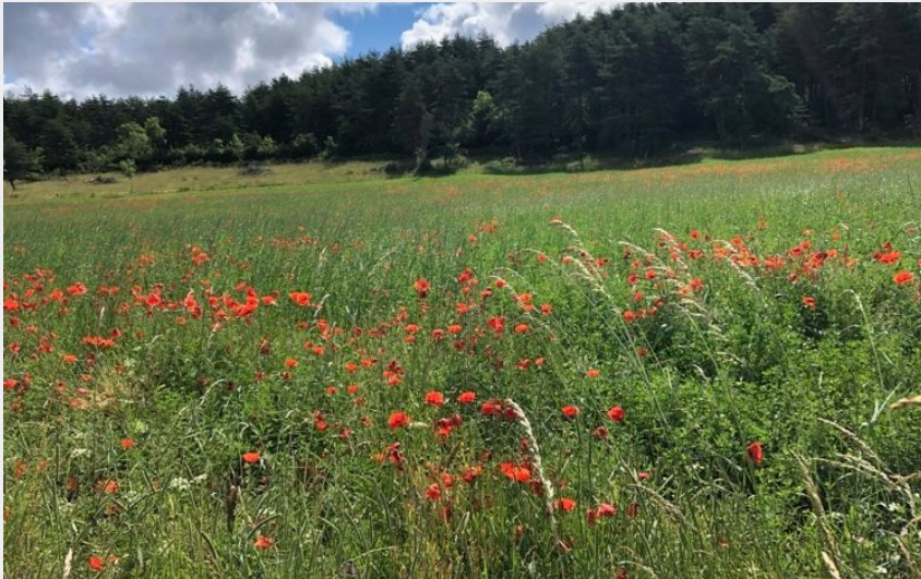
Champs de coquelicots