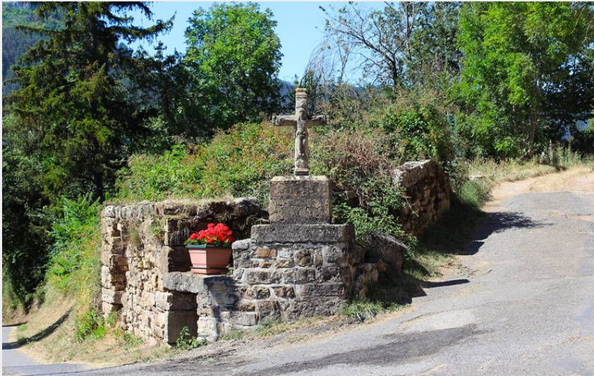
Croisement de chemins à Pelgeires