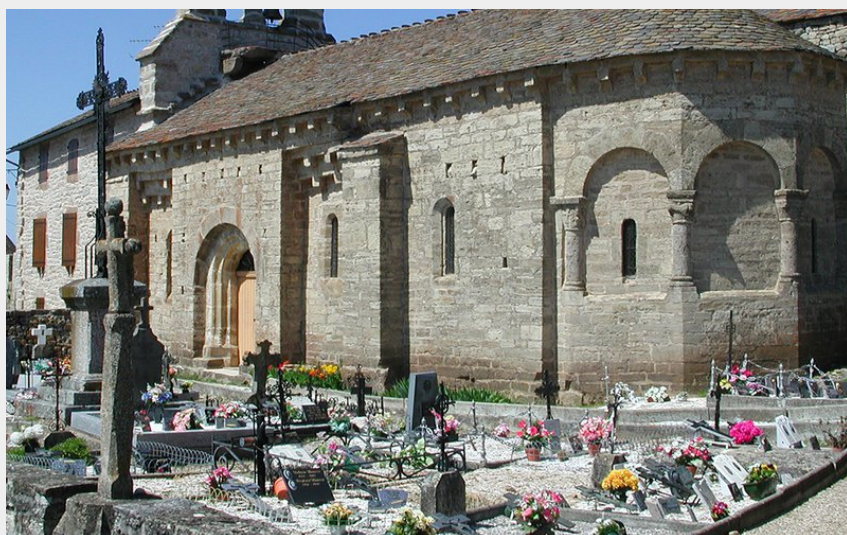
Église de La Rouvière (OTI Mende)