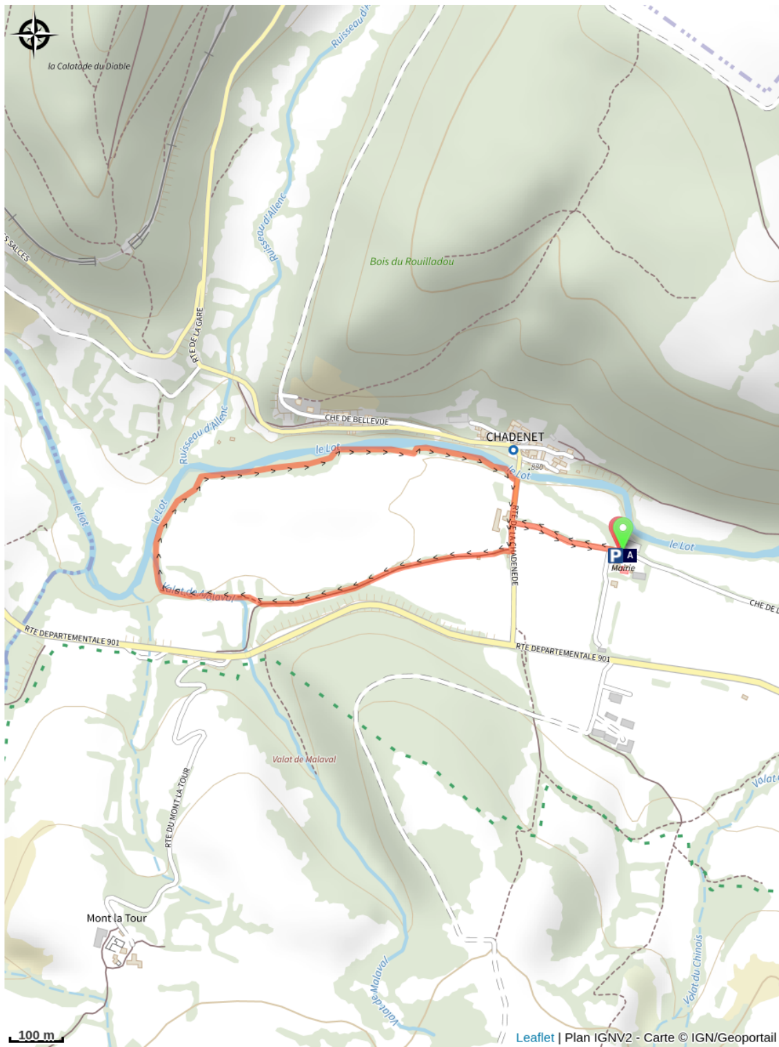
L'Eglise Saint-Privat (A)