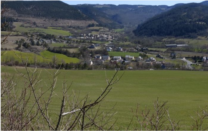
Vue sur Lanuéjols