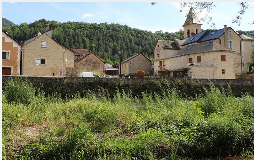
Les Salelles (OTAGDT)