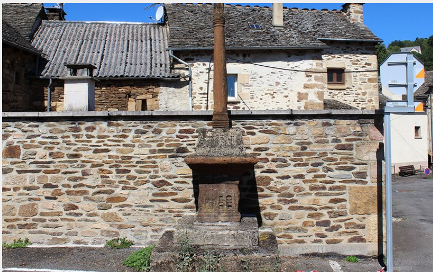
Croix remarquable à Badaroux (48) (FS - OTI Mende)