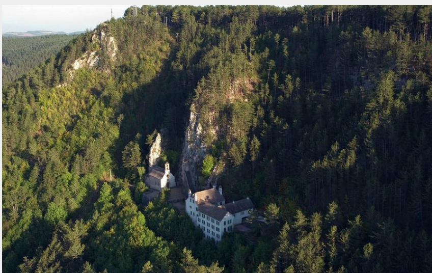
Hermitage Saint Privat