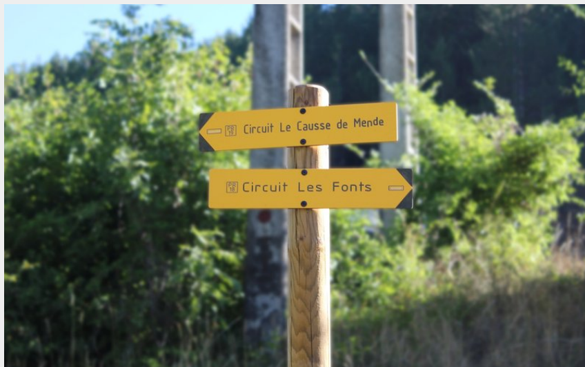
Croisement de 2 sentiers au Fonts (FS - OTI Mende)