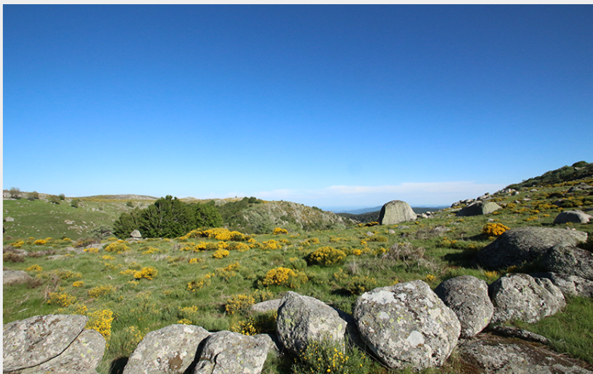
Draille de l'Aubaret