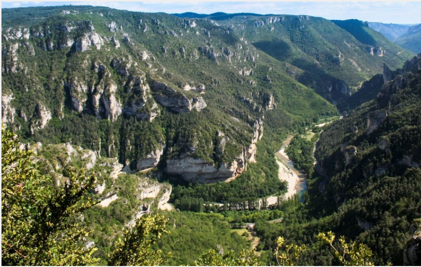
Le panorama du Point sublime.