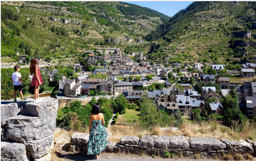
Vue sur la cité médiévale de Ste Enimie, labellisé parmi les plus beaux villages de France.