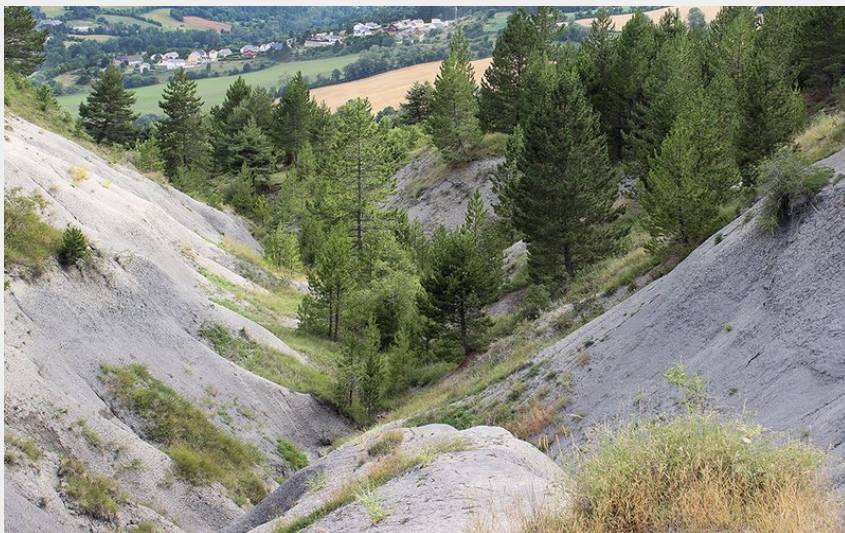
Marnes Bleues - Falaises de Barjac