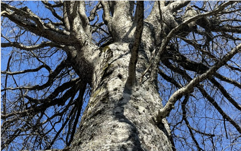
Arbre remarquable sur le circuit