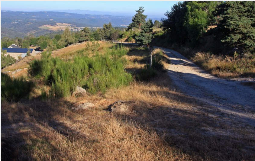
Arrivée sur le village de Saint-Alban-sur-Limagnole (OT Margeride en Gévaudan)